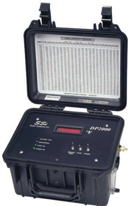
DP2000 – Портативный № по каталогу 13070

Модель DP2000 является легким портативным прибором, корпус которого изготовлен специально для работы в термообработывающей промышленности. Время работы от батареи – 8 часов.