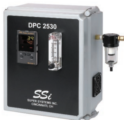
DPC2530 – Непрерывный измеритель № по каталогу 13118

Модель DPC2530 поддерживает передачу данных по протоколу Modbus @ RTU, позволяя пользователю регистрировать параметры процесса.